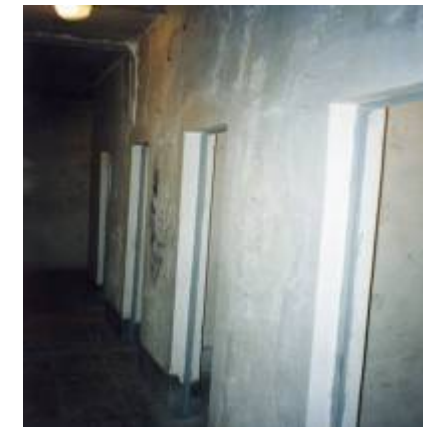
رى زېك ژوررى تاك

تەسكەدا چەند ژورېك دروست كرابوو له يادم باش نيبه ئايا سى ژورر بوو يان بەرەو سەر من له ترسى نازارى گيانم و له ترسى ئەو داها تووهى كه دېته بەرچاوم زۆر بەناگا نەبووم دياره تو چاوه پروانى پارچه پارچه كردنى خۆت دەكەيت ئەو شوپنە يە كەم شوپنى سەرەتايى بوو كه دەچوو پتە ژوررەو ئەگەر هېچ نەبوو پتايە هېچ شتېك لەسەرت نەسەپن بەس چوونە ژوررەو شەش مانگ دەمايتەو خۆ ئەگەر بۆنى رېكخراو پتە لېبھاتايە ئەو دادگا چاوه پى بوو بۆت، خۆ ئەگەر بە بەلگەو بەگريپت ئەو پېدە چيپت هەر لەویدا خويان بە ئەشكەنجە دان بىكوژن، منيان كرده ژورېكى تاكەو دەرگايان داخست لېم، بە تەقەى دەرگاكاندا